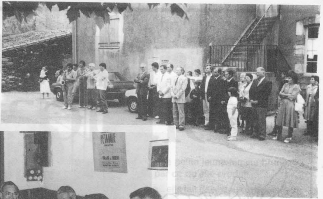
Après la messe dominicale. Dépôt de gerbe et sonnerie devant le monument aux morts.