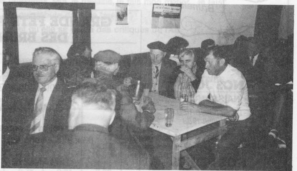
Apéritif encore ! Il faisait chaud...