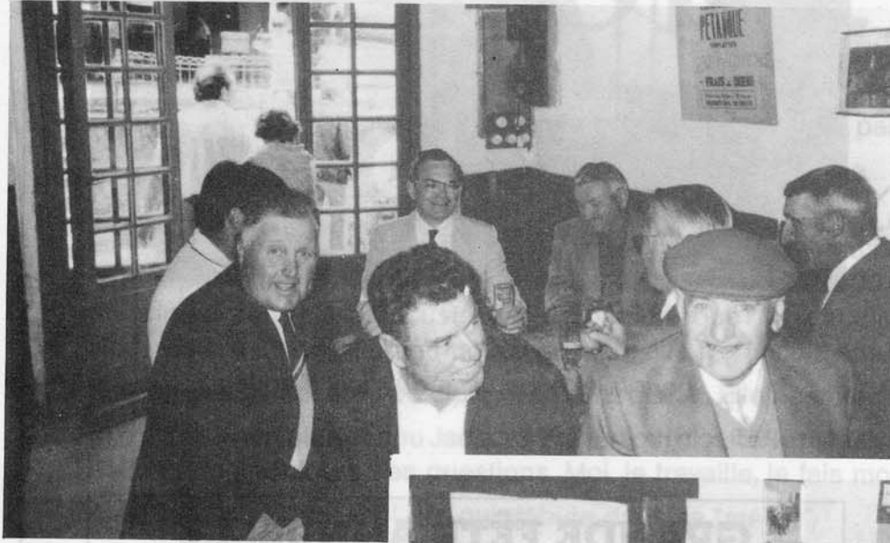
Apéritif à la santé des vivants.