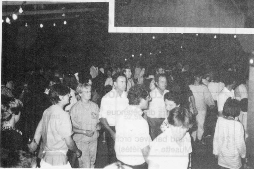
Dernier bal des Brunels sous la toile...