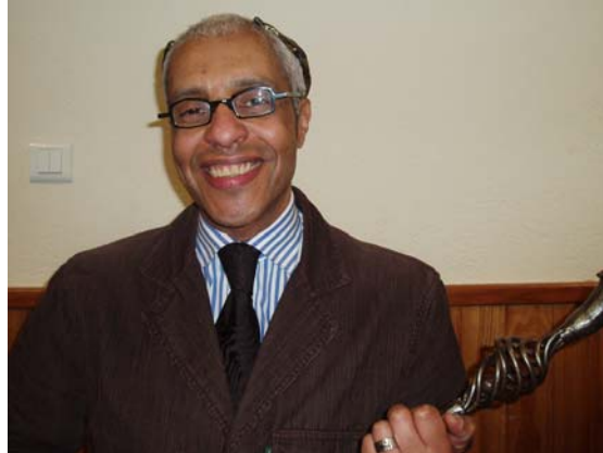
Le « Grand Ours 2009 »

Le 21 février nous nous sommes retrouvés à la salle des fêtes pour la désormais traditionnelle « Fête de l'ours ». Après un bon repas, au moment du dessert, et pour la deuxième année consécutive, celui qui trouverait dans une des galettes des rois, une fève en forme d'ours, se verrait désigné comme étant « Grand Ours de l'année ».