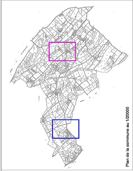
Plan de la commune au 1/20000