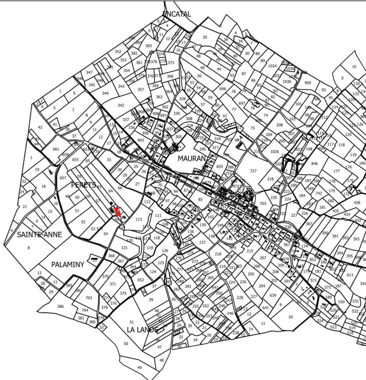
Carte de localisation des bâtiments en zone A susceptibles de changer de destination